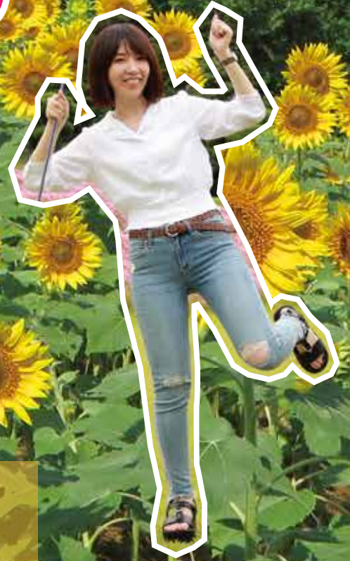
7月下旬～8月下旬のお花：ひまわり

「のこのしまアイランドパーク」は、博多湾の中央に浮かぶ周囲12kmの「能古島」にある自然公園です。年間を通して季節の花が咲いているので、行く度に違った景色に出会える都会の中の花の楽園！ビートル利用者限定の特典もありオススメのスポットです！