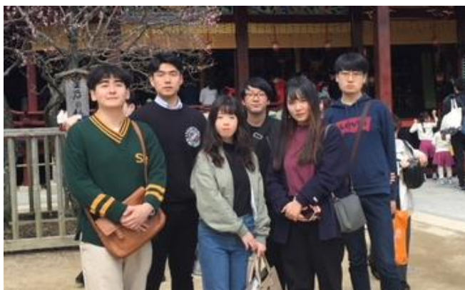
フレンドリーガイドの6名