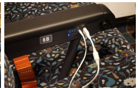
普通席 USB 充電&イヤホン